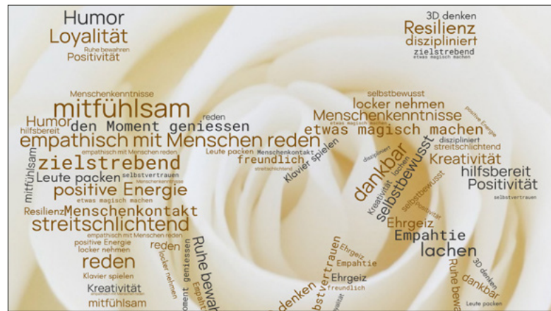
Die Talente unserer Firmand:innen.

Im Rahmen der Vorbereitung auf die Firmung haben sich die Jugendlichen durch einen Sozialeinsatz auch mit dem «Dienst am Nächsten» auseinandergesetzt.