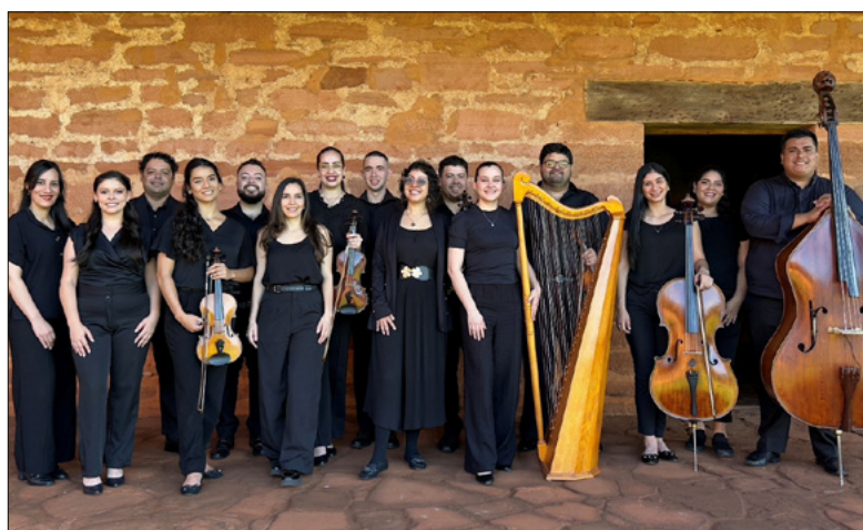
«Sonidos de la Tierra» aus Paraguay musiziert in der Jesuitenkirche.