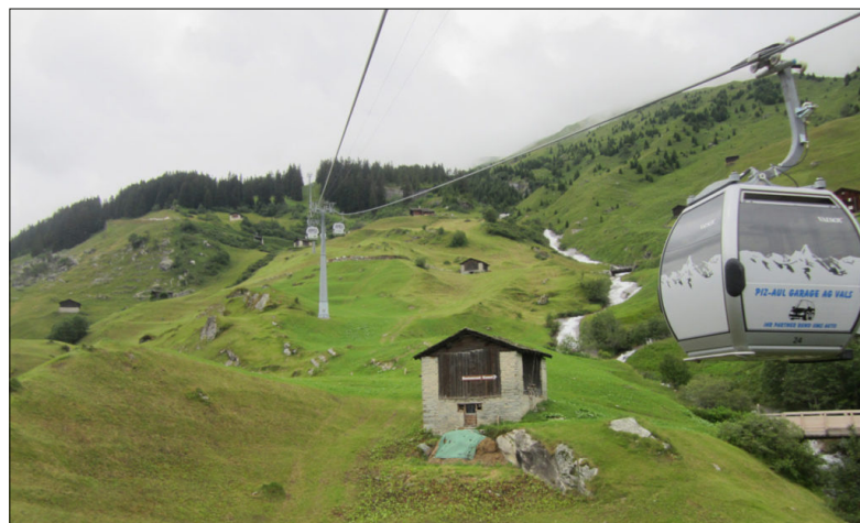
Wandern in den Bergen Graubündens.

SO, 5. Juli, 16.15 bis SA, 11. Juli, 14.00, Haus der Begegnung, Klosterweg 16,