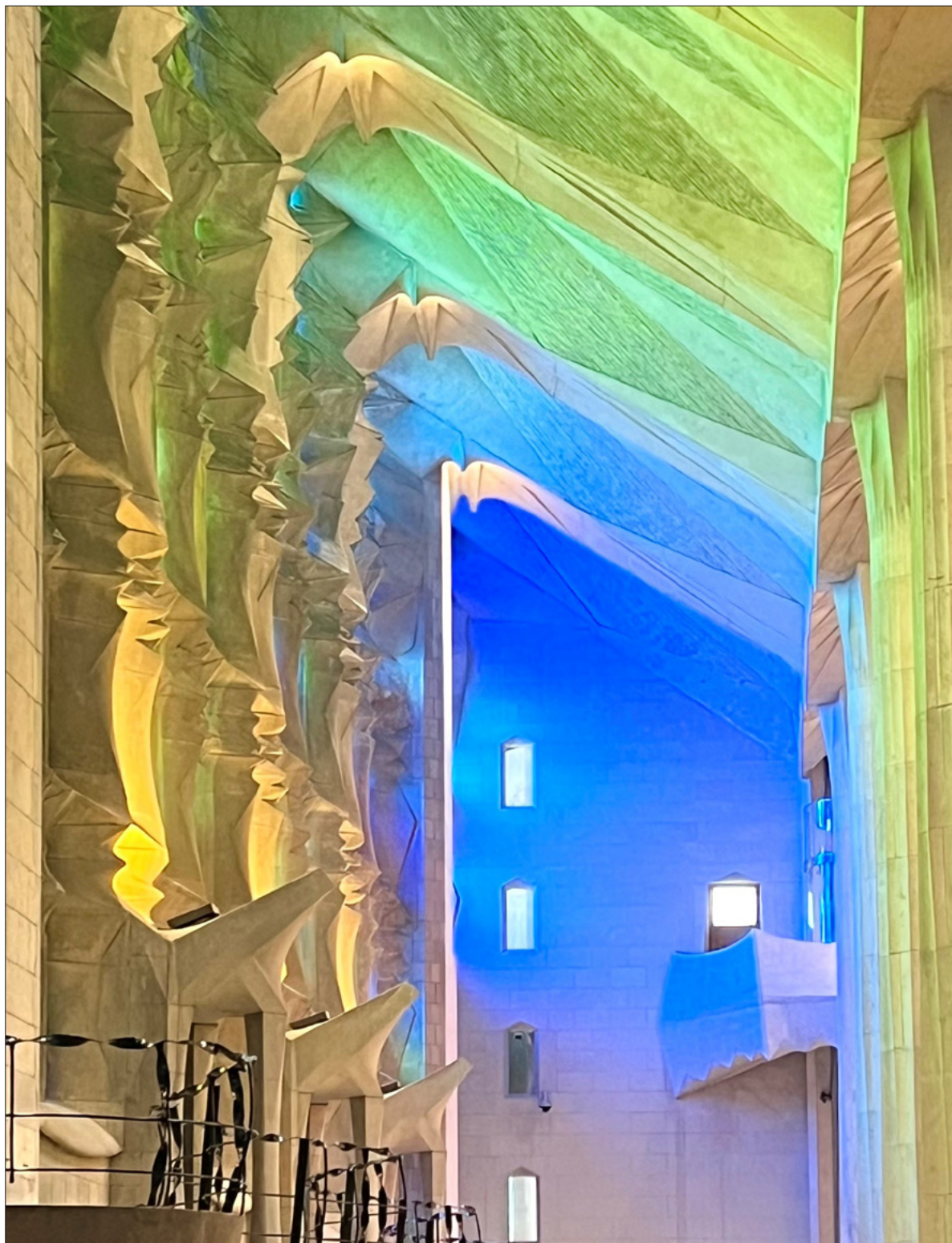
Ein Seitenschiff in der Basilika Sagrada Família in Barcelona (Spanien).

Christliche Influencer:innen ziehen auf Social Media Tausende Follower:innen an. Teils mit problematischen Inhalten. Deshalb sollten die Kirchen auch auf Social Media präsent sein. Seite 3