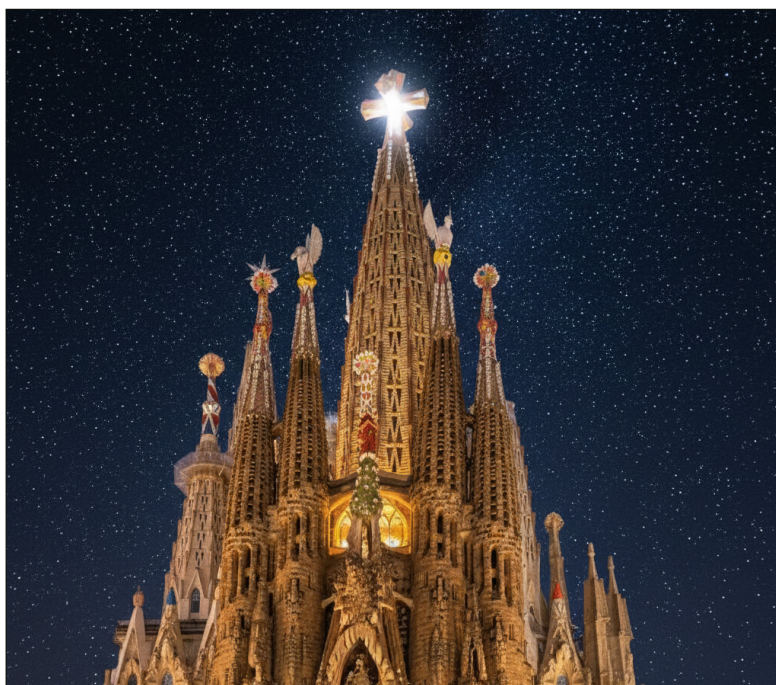
Die Kathedrale Sagrada Família mit dem höchsten Kirchturm der Welt.

Die Matinee über den Architekten Gaudí und die Sagrada Família vom Sonntag, 10. Mai, 10.30 Uhr ist eine Komposition von Fotos, Worten und Musik.