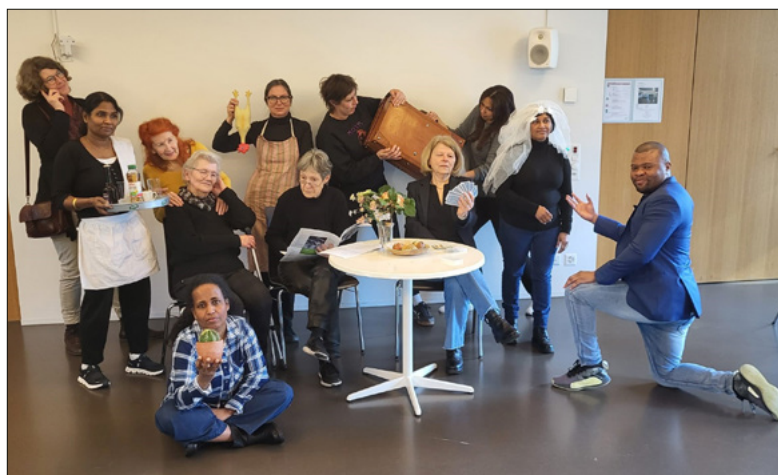
Das generationen- und herkunftsdiverse Ensemble probt mit grossem Einsatz.

20 Jahre Zusammenleben Maihof-Löwenplatz! Das Jubiläum wird an der Jahresversammlung vom 8. Mai mit einem selbst erarbeiteten Theater gefeiert.