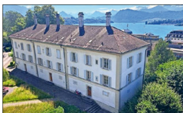
Seminar St. Beat in Luzern.