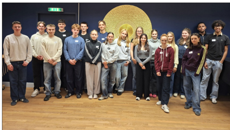
Firmgruppe aus den Pfarreien St. Maria zu Franziskanern, St. Paul und St. Leodegar im Hof.

Am Sonntag, 10. Mai um 11 Uhr dürfen in unserer Pfarrkirche 18 junge Menschen das Sakrament der Firmung empfangen.