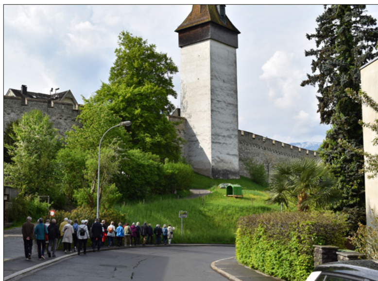
Feierlicher Umzug in Richtung St. Karl.

Der Musegger Umgang hat eine lange Tradition. Auch das Feiern von Traditionen ändert sich. So findet er vorläufig zum letzten Mal in dieser Form statt.