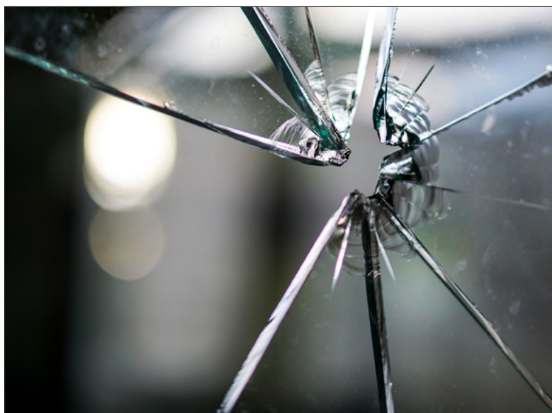
Ein Menschenleben ist zerbrechlich. Missbrauch kann Menschen zerstören.