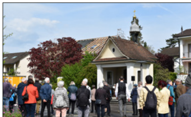
An der Museggkapelle startet der Bittgang.

Seit mehr als 500 Jahren findet der Musegger Umgang statt, ein Bittgang für die Stadt Luzern entlang der Luzerner Stadtmauer. Nahmen im Mittelalter noch mehrere Tausend Menschen am Bittgang teil, so wurden es mit der Zeit immer weniger. Durch die Jahrhunderte wurden auch kritische Prediger dazu eingeladen. Dies zeichnete den Musegger Umgang aus. Nun findet er in dieser Form zum letzten Mal statt. Zu dieser langjährigen Tradition mit Kommunionfeier und anschliessendem Apéro laden ein: die Pfarreien St. Karl, Der MaiHof – Pfarrei St. Josef und St. Leodegar sowie der Quartierverein Luegisland. Es spielt das Luzerner Brass-Quartett.