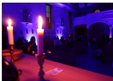
In blaues Licht getaucht.

Mit unserem monatlichen Blue Friday greifen wir diese Stimmung auf. Die Kirche taucht in blaues Licht, Jazz erklingt, die Bar ist offen. Warum tun wir das? Weil wir glauben, dass Glaube nicht nur in klaren Antworten lebt, sondern auch in