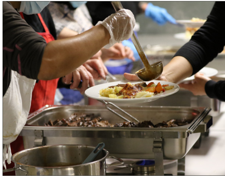
Helpende Hände beim Mittagstisch.

Freiwilligenarbeit verbindet Menschen unterschiedlicher Altersgruppen und Herkunft durch ein gemeinsames Ziel und bereichert das Leben.