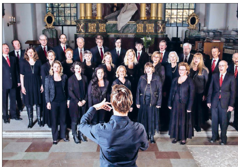
Der Chor Cappella Catharinae.

Cappella Catharinae ist ein gemischter Erwachsenenchor, der in Stockholm der Katarina-Gemeinde angeschlossen ist. Der Chor hat etwa 40 Mitglieder und wurde 1969 gegründet. Seither hat der Chor 980 Konzerte gegeben und mehr als 230 Lieder erarbeitet, so die Angaben auf seiner Internetseite.