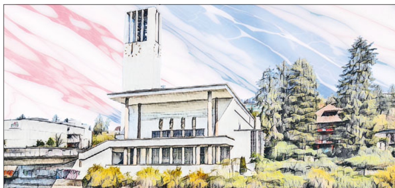
Die Pfarrei St. Karl – gemeinsam vielstimmig und ideenreich unterwegs.

Kirchenchöre kämpfen ums Überleben. Die Pfarrei St. Karl stellt sich den Herausforderungen. Ihre Kirchenmusik geht auch unübliche Wege – mit Erfolg.