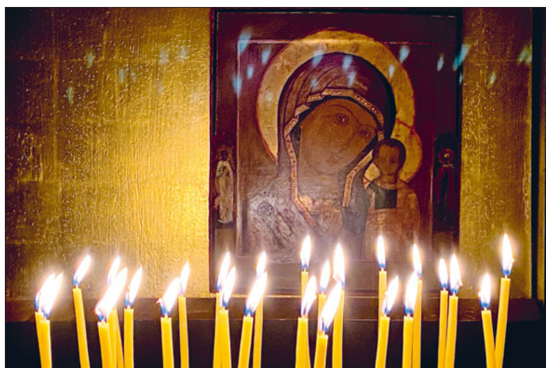
Ikone der Gottesmutter Maria.