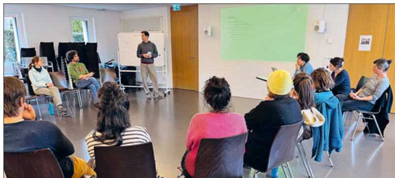
An der Generalversammlung von «MaiSpross» werden verschiedene Produzent:innen vorgestellt.

Das Konsumverhalten bestimmt, unter welchen Bedingungen Lebensmittel hergestellt werden. Der Verein «MaiSpross» fördert bewusstes Konsumverhalten und schafft eine nachhaltige Alternative zum bestehenden Ernährungssystem.