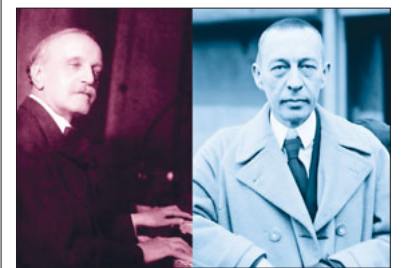
Louis Vierne (1870–1937) und Sergei Rachmaninow (1873–1943).