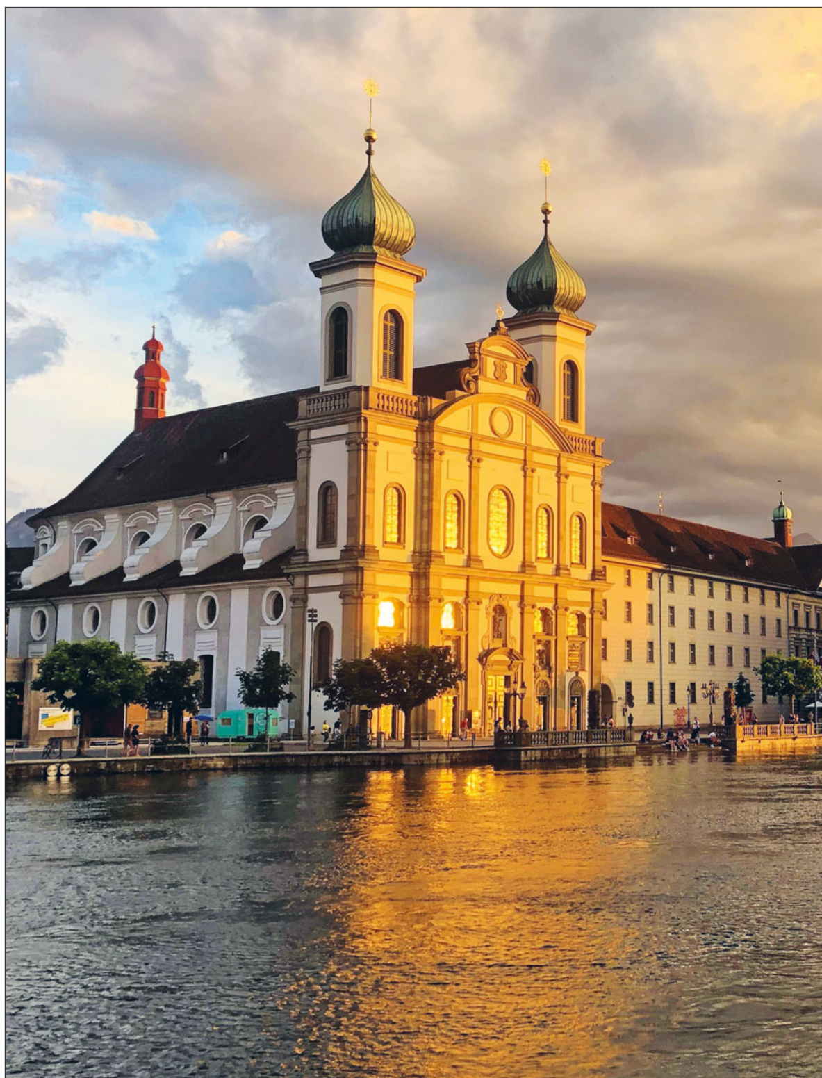
Die Luzerner Jesuitenkirche im Abendlicht (2021).

Ende April und Anfang Mai sind die Katholische Kirche und die Christkatholische Kirche an der LUGA vertreten. Am 4. Mai stellt sich die Katholische Kirche Stadt Luzern den Fragen der Besuchenden des Marktplatzes 60plus. Seite 15