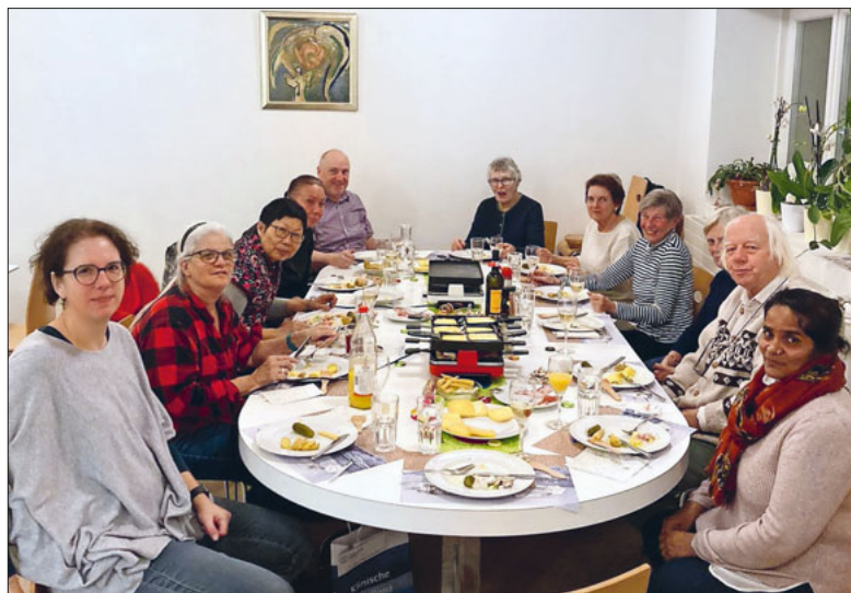
Team Sonntagskaffee: Danke für den phänomenalen Einsatz.

Freiwillige ermöglichen das vielfältige Pfarreileben in St. Paul: freiwillig – engagiert – phänomenal – danke!