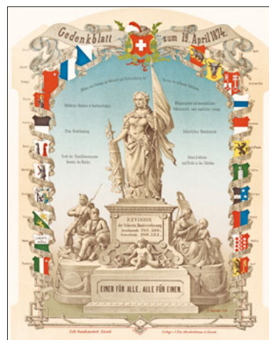
Gedenkblatt zur Abstimmung über die Bundesverfassung der Schweiz vom 19. April 1874.