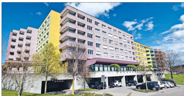
Die farbigen Häuser des Staffelnhofs sieht man von weit her.