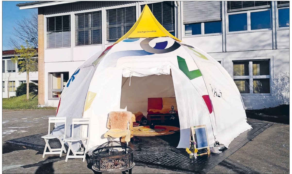
Das Zelt, in dem die Schüler:innen in die Welt der Geschichten eintauchen konnten.